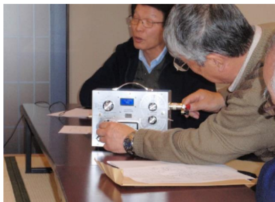
総会 風景 KJH局の話に聞き入っています